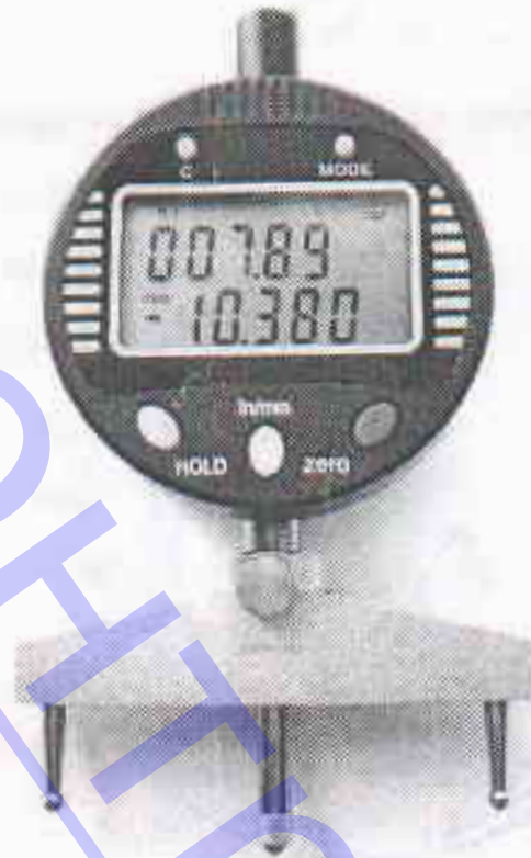
Рисунок А.1 – Радиусомер индикаторный цифровой РИЦ-5-1000-0,01