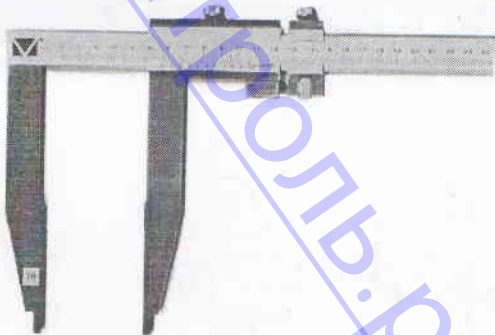
Рисунок А. 1 – Штангенциркуль ШЦ- III